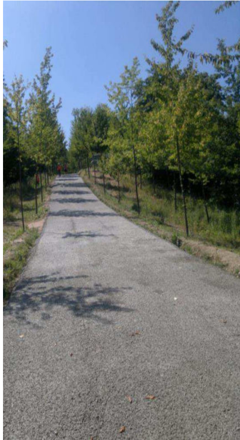
2012 – 1.000 mq